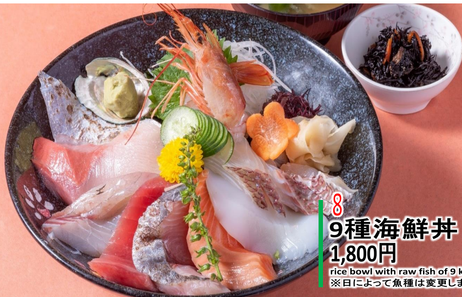
8 9種海鮮丼 1,800円 rice bowl with raw fish of 9 kinds ※日によって魚種は変更します