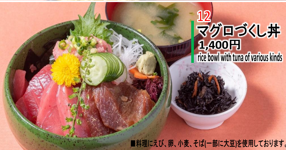
12 マグロづくし丼 1,400円 rice bowl with tuna of various kinds