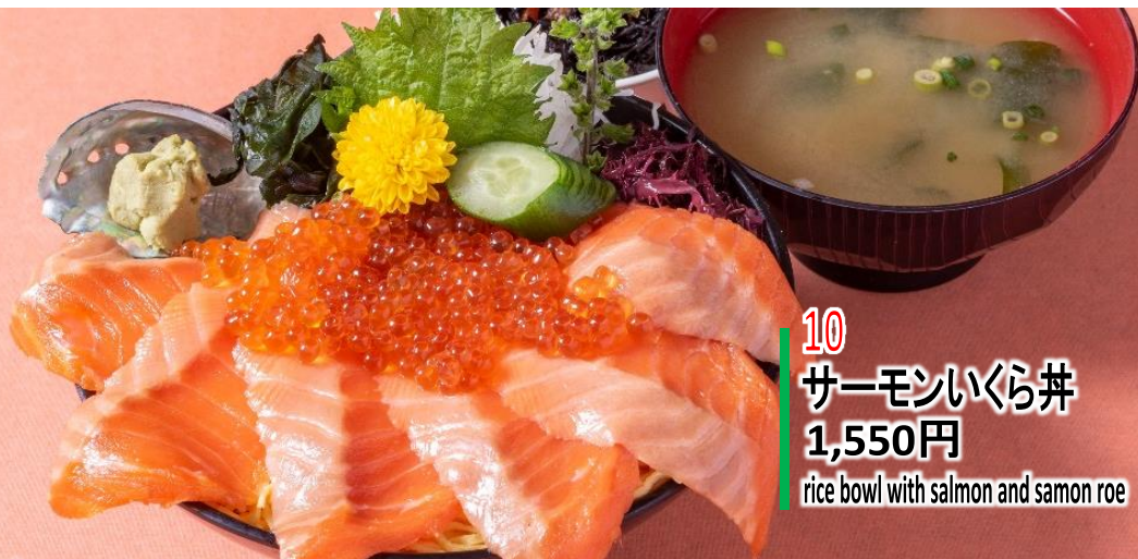
10 サーモンいくら丼 1,550円 rice bowl with salmon and samon roe