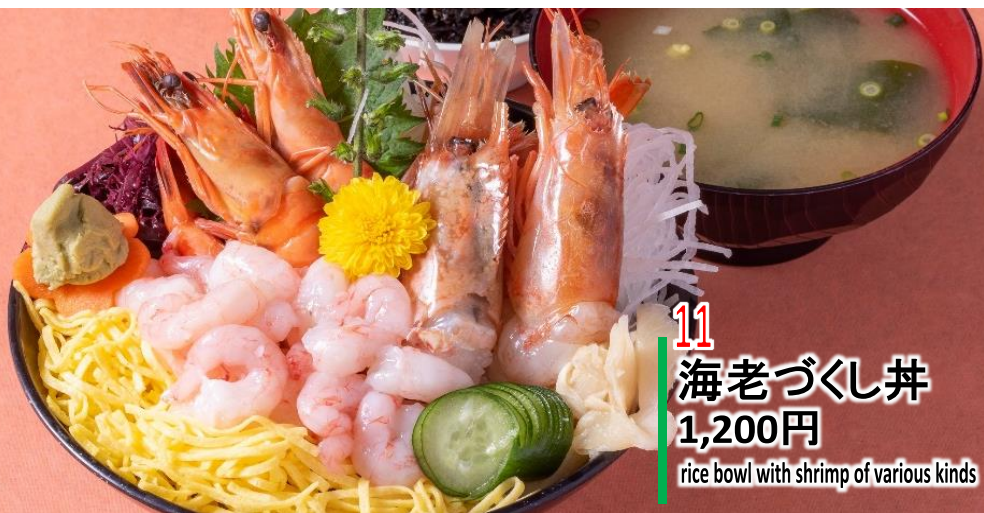
11 海老づくし丼 1,200円 rice bowl with shrimp of various kinds