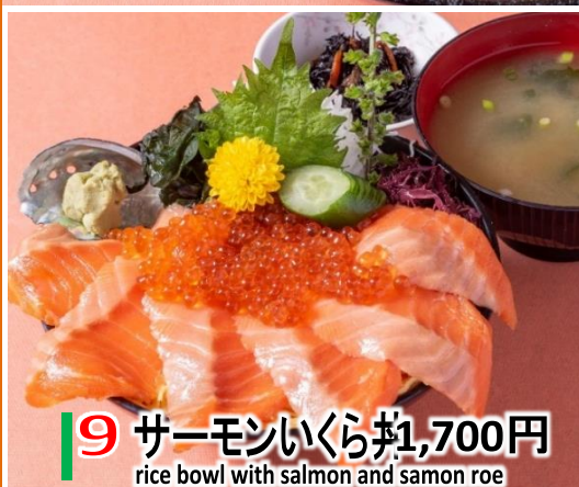
9 サーモンいくら丼 1,700円 rice bowl with salmon and salmon roe

rice bowl with raw fish of 9 kinds ※日によって魚種は変更します