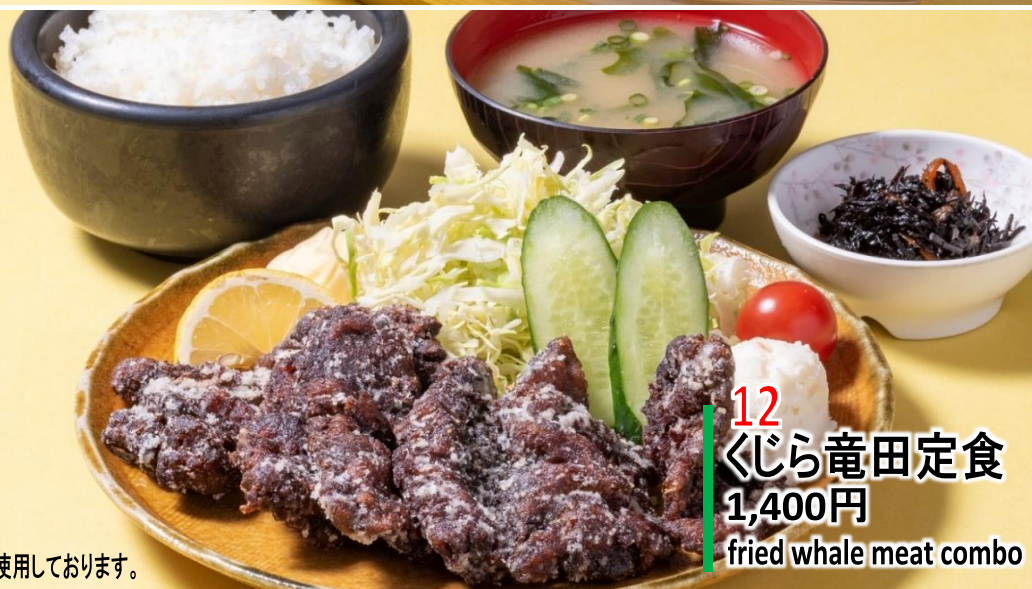
12 くじら竜田定食 1,400円