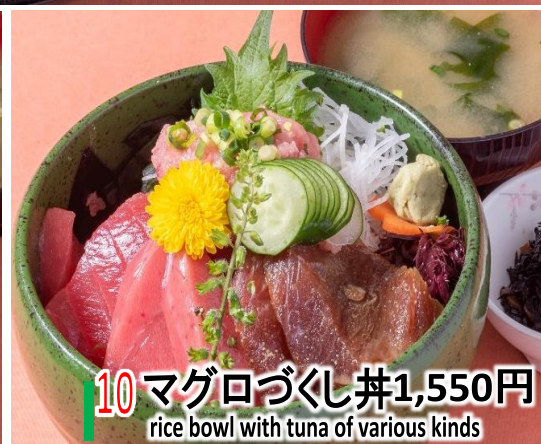
10 マグロづくし丼 1,550円 rice bowl with tuna of various kinds