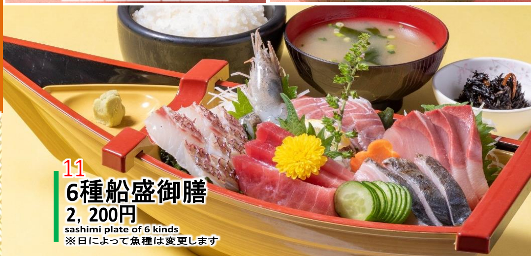
11 6種船盛御膳 2,200円